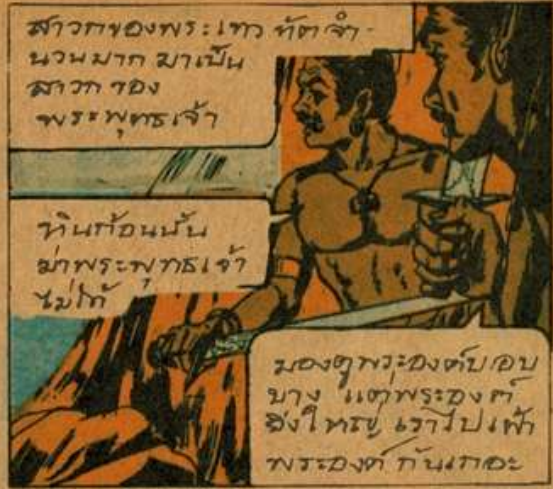
สาวกของพระเวท หักจำ- นวนมาก มาเป็น สาวกของ พระพุทธเจ้า