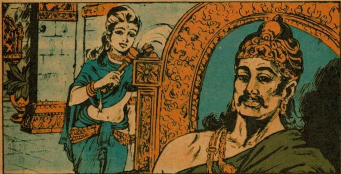
ณ หิองภพานิมาลย์ มีเมืองเล็ก ๆ เมืองหนึ่งชื่อ กบิลพัสดุ์ เป็นเมือง อุตมคัมภรณ ปกครองโดย ชกทองค์ กบิลพัสดุ์ทรงปกครองในสมัยในหลวงพระนามว่า "สีหโชนะ"