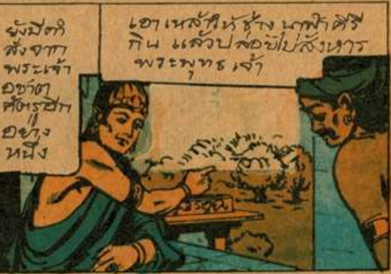
ยังมีที่ สั่งจาก พระเจ้า อชุต ศัตร์ธาก อย่าง หนึ่ง