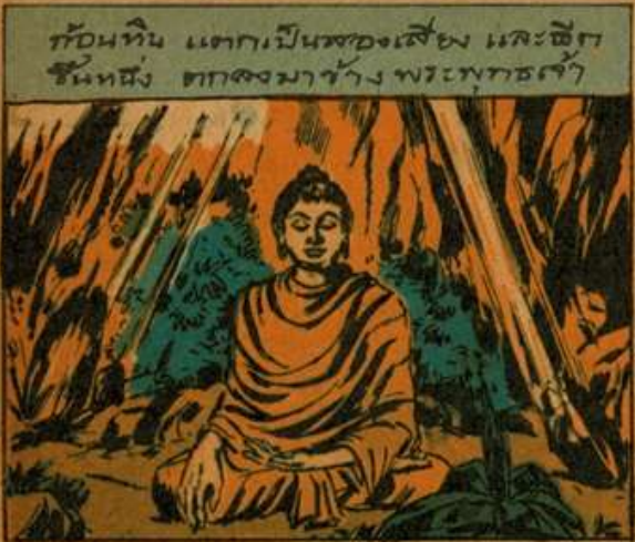
ก้อนหิน แดกเป็นทองคำและเหล็ก หินหนึ่ง ตกลงมาข้าง พระพุทธเจ้า