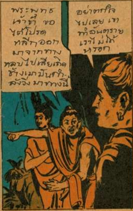
พระพุทธ เจ้าที่ ขอ ไปตัดโปรด ทศิฑ์ออก มาจากทาบ หลบไปเสียเถิด ข้างเมฆมันก็ ลิ่งจิ่ง มาทางนี้