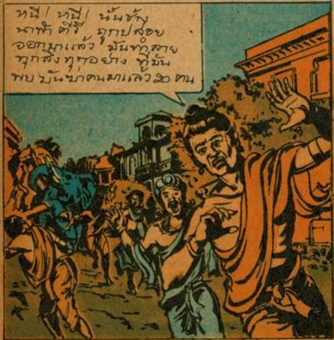
หนี! หนี! หนีซะ นาคี ศัตร์ ถูกปล่อย ออกมาแล้ว มันทุกสาย ทุกสิ่งทุกอย่าง ที่มัน พบ มันฆ่าคนมาแล้ว 20 คน