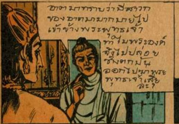
ชาติมากทาบว่ามีสาวก ของชาติมากมาขโมยไป เข้าข้างพระพุทธเจ้า