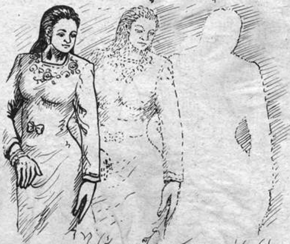
ไปสู่วิชาเป็น อุชาวัตติ (๒๖๖/๒๖๗)

คำว่า "คณฺห" ก็คือสิ่งที่เรียกว่า "สัญญา" หรือ "อนัตตา" นั้นเอง มิใช่ว่ามีตัวตนให้เห็นหรือเป็นคณฺหคือไม่มีอยู่เลย ตามวิสัยของโลก (โลกียวิสัย) มันมีอยู่ แต่เราทำใจได้ว่ามีไม่มีอยู่ คือไม่เอาใจไปยึดว่ามี เพราะถ้าไปยึดว่ามีก็เกิดชอบ - ชัง - หวงแหนขึ้น คือทำใจให้ว่าง คำว่าใจว่าง มิใช่ใจที่ขาดสติไม่รู้ตัวรู้ตัว เป็นใจเหมือนใจคนธรรมดา ๆ แต่เป็นใจที่ไม่ยึดถือเอาทกสิ่งภายนอกกายมาเป็นอารมณ์ - มายิตมัน ก็อมัน เป็นลักษณะที่ ท่านพุทธทาส - พุทธบัณฑิตกล่าวไว้ว่า "ใจว่าง" หรือ "จิตว่าง" นั้นเอง คือเป็นใจที่ว่างเห็นอะไร ๆ ทุกอย่าง แม้ว่าจะมีอยู่ให้เห็นด้วยตา แต่ใจก็ไม่เห็น ไม่ยอมรับเอาเข้ามาสู่ใจให้เป็นทุกข์นั้นเอง