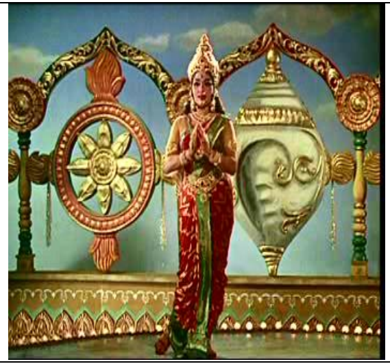
พระแม่ลักษมี