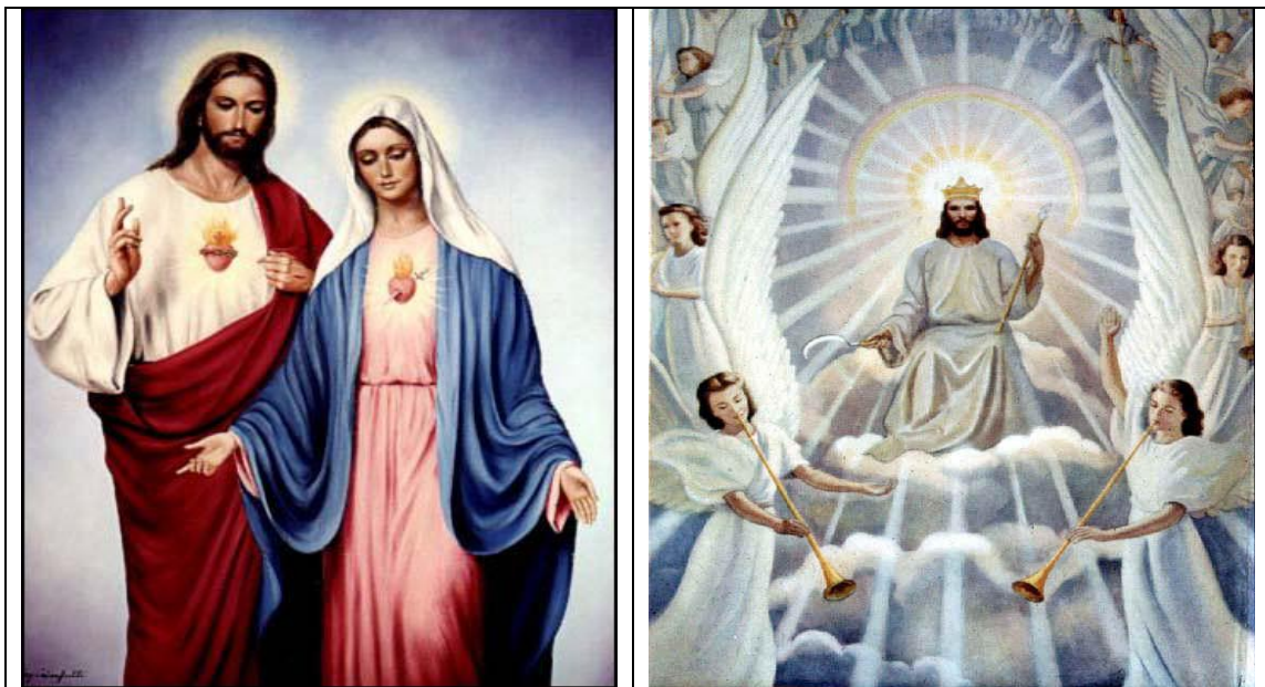
พระเยซู และพระแม่มาเรีย

จักรพรรดิ เทพเจ้าผู้รักษา คือ พระเยซู และ พระแม่มาเรีย