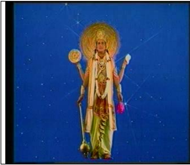
พระนารายณ์