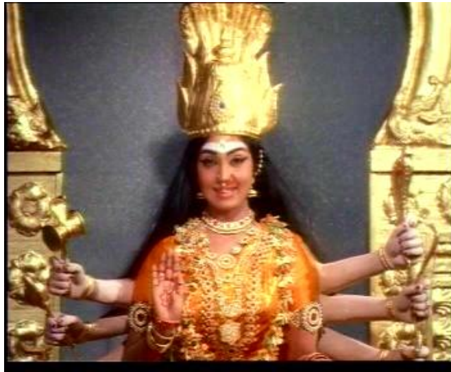
พระแม่ดูรกา

เทพเจ้าประจำจักระ ตรงกลางของจักรหัวใจ คือ เจ้าแม่ดูรกา