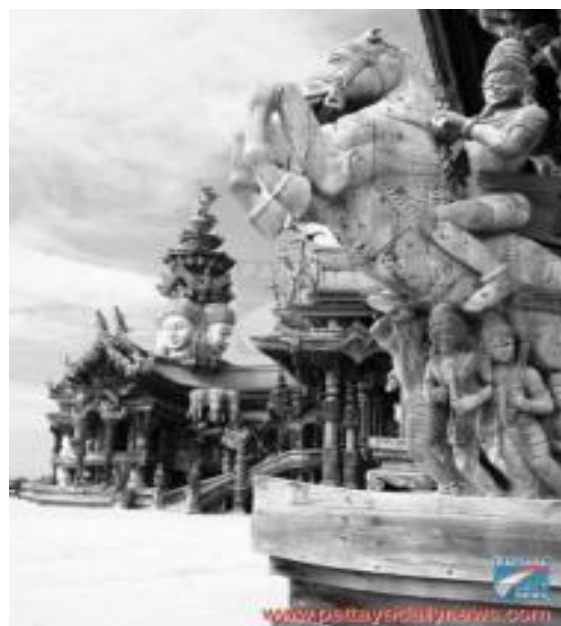
พระศรีกัลกิ