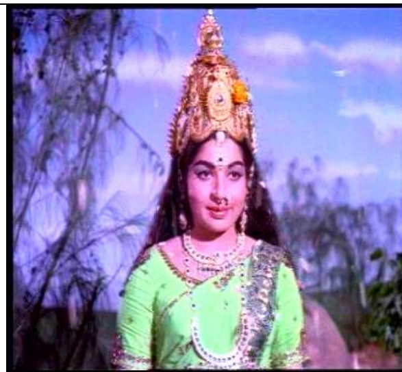
พระแม่ปารวตี