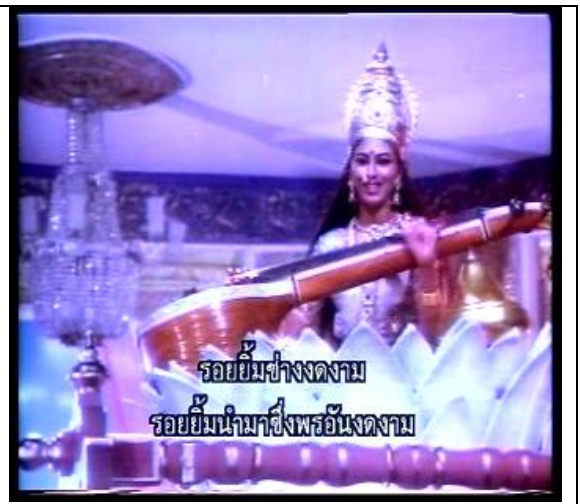
พระแม่สุรัสวดี